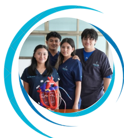
Licenciatura en Terapia Física.