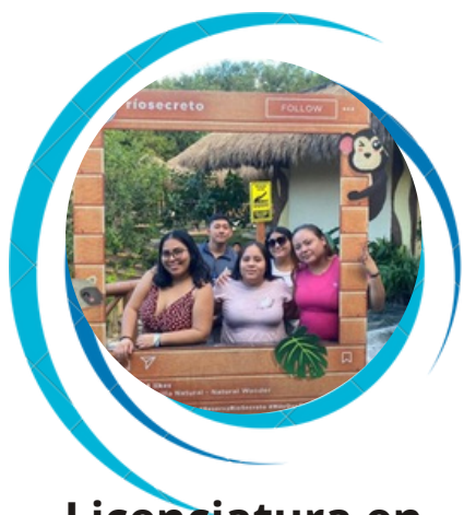
Licenciatura en Gestión y Desarrollo Turístico.