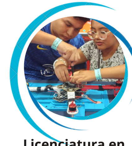
Licenciatura en Ingeniería en Tecnologías de la Información e Innovación Digital.

La Universidad Politécnica de Bacalar, a través de la Dirección General de Universidades Tecnológicas y Politécnicas, convoca a los aspirantes interesados en cursar una licenciatura para el ingreso al ciclo escolar 2025-2026 a presentar la evaluación diagnóstica que se realizará del 22 de febrero, conforme a los siguientes requisitos y condiciones: