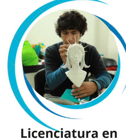
Licenciatura en Ingeniería en Animación y Efectos Visuales.