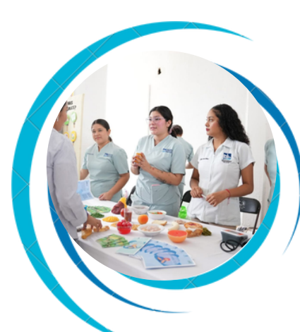
Licenciatura en Nutrición.